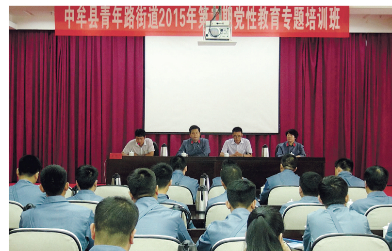
青年路街道在井冈山举办党性教育培训班