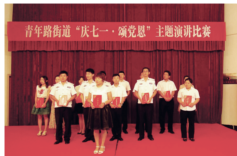
青年路办事处举办庆七一颂党恩演讲比赛