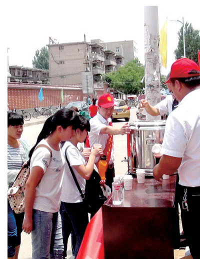
青年路办事处志愿者爱心助力高考学子

(二)完善矛盾调化解机制,维护辖区稳定环境。成立村级人民调解委员会,除发挥村民调委员、联户代表的主力作用外,还吸纳聘请“村五老”,即农村老党员、退休返乡老干部、离任老村(组)干部、德高望重的老人、乡村退休老教师为义务调解员。依托“五老”人熟、地熟、情况熟以及群众基础好、威信高、懂政策的优势,有效化解各类民间纠纷。另外,把全村划分出若干网格,每个调解员分包一个网格,定期走访排查群众需求和矛盾纠纷,全部主动帮助解决,实现了“小事不出组,大事不出村,矛盾不上交”的工作目标。