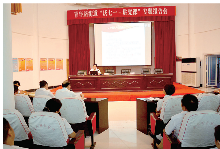
高端专家大讲堂——邀请郑州大学教授郑发展授课