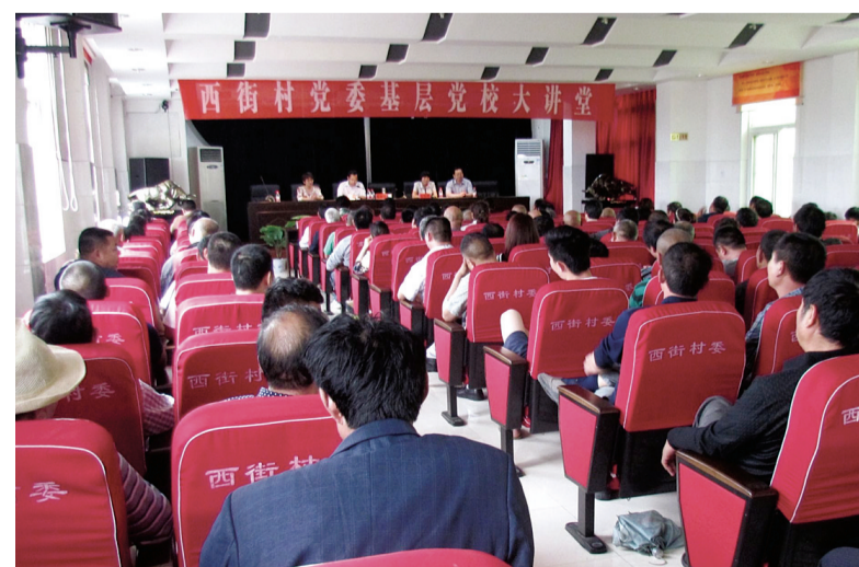
农村基层党建示范点——西街村