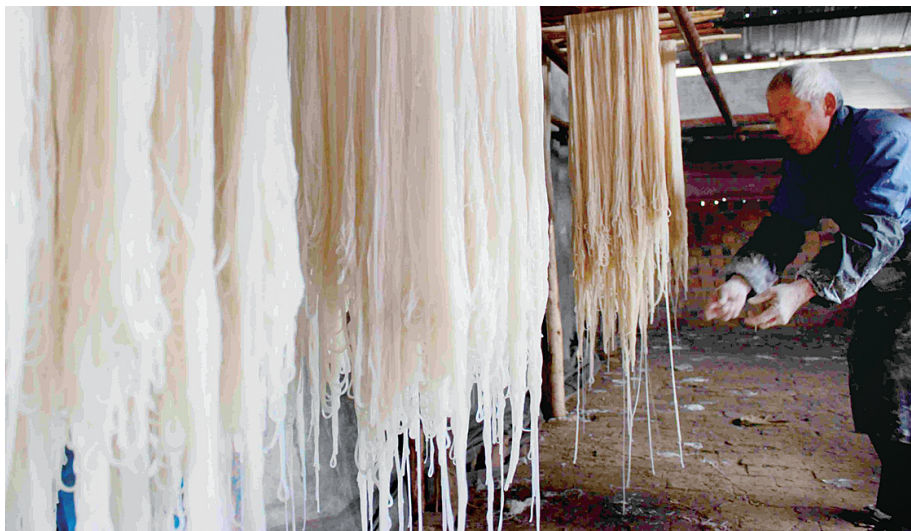
手工粉条的晾晒是一道亮丽的风景线