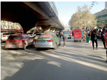
河医立交附近机动车乱停乱放