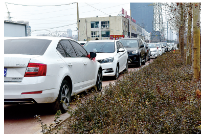
北三环生态廊道自行车道上停了很多车