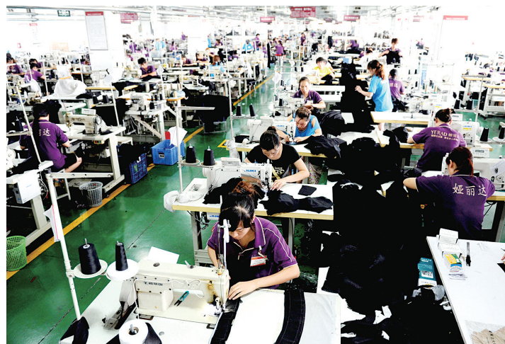
娅丽达女裤生产车间

目前,我市共有8家企业建立了省级技术研发中心,10家企业建立了市级技术中心,30家企业获得省著名商标称号,其中,领秀·梦舒雅、渡森、娅丽达、太可思等荣获“中国驰名商标”。近年来,我市对获得国家、省级名牌产品、省著名商标、中国驰名商标的纺织服装企业,累计奖励金额近千万元,鼓励服装企业扩大规模,争创名牌产品、驰名商标,提高纺织服装品牌影响力。