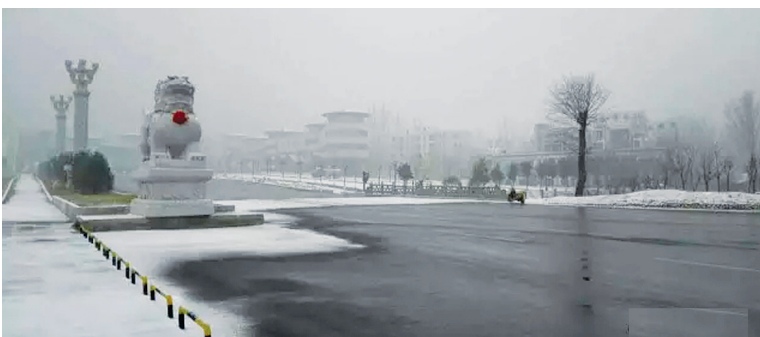
抢下雪的时候,怎么少得了栾川。