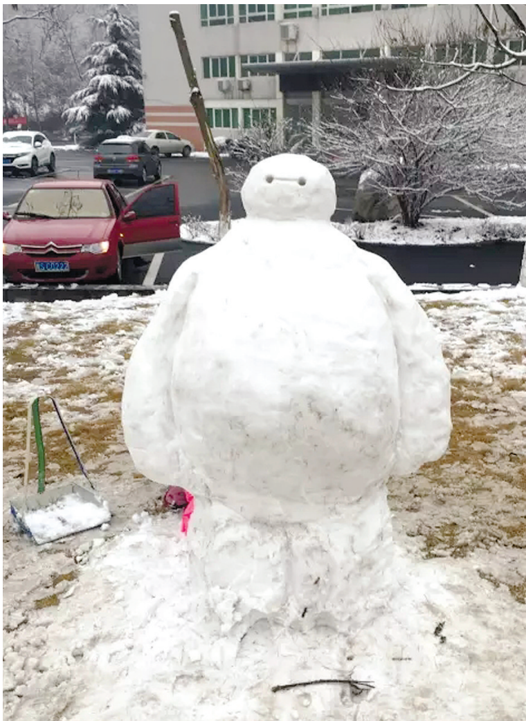
信阳师范学院内的雪人“大白”,萌萌哒。

明天20时~后天20时,华北中南部、黄淮大部、江淮、江汉东部、陕西关中、东北地区中部等地空气污染气象条件为3~4级,有轻至中度霾。