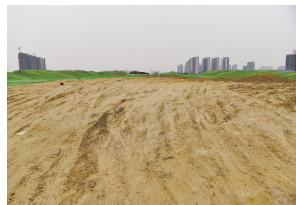
苗郭路一丁地上仍有大量黄土没有覆盖