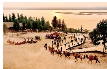
景区孤柏渡“异域风光”引人入胜