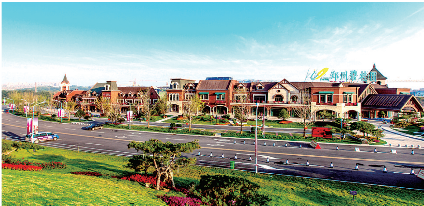
全国知名地产商纷纷抢滩荥阳。图为美丽的碧桂园小区