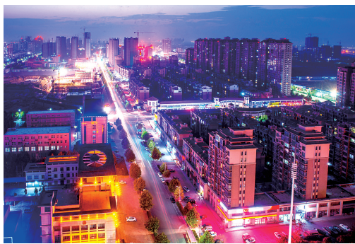
荥阳省级示范特色商业街:海龙商业街