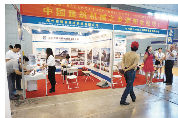
2015年7月20日荥阳市工程机械企业参加新疆国际工程机械展