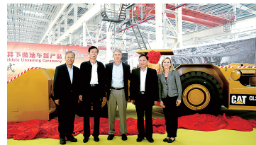
卡特彼勒有限公司井下柴油车下线纪念

以“严”强保障,党建水平全面提升 扎实开展“三严三实”专题教育,聚焦对党忠诚、干净干事、敢于担当;加强领导班子和干部队伍建设,领导能力进一步提升;全面落实“4+4+2”党建制度体系,成立领导小组,出台相关文件,加强指导督导,全市29个软弱涣散村级党组织完成整顿。落实党风廉政建设各项规定,创建省级廉政文化示范点1个、郑州市级4个,建成廉政文化教育基地廉苑、荥阳市预防职务犯罪警示教育基地;成立荥阳市委巡察机构;开展“不作为、慢作为、乱作为”专项整治;保持惩治腐败高压态势,着力营造风清气正的良好环境。