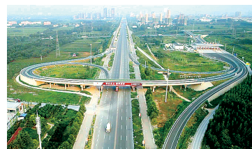
进出荥阳很便捷(中原路与绕城高速出入)