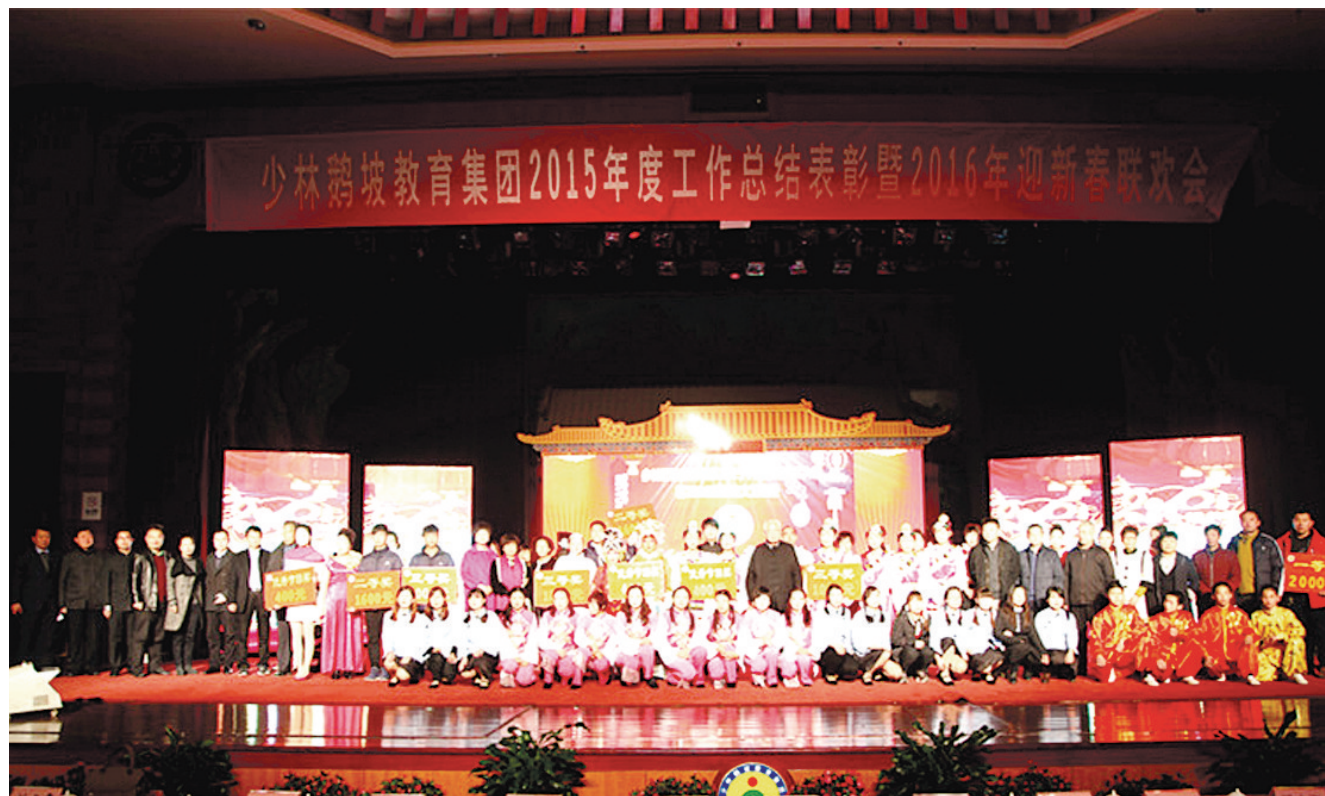
鹅坡教育集团举行2015年表彰总结大会暨2016年迎新春联欢会

火树银花不夜天,欢歌笑语舞蹁跹。1月10日,鹅坡教育集团2015年度先进表彰大会暨2016年迎新春联欢会在禅武大酒店展武堂隆重举行。