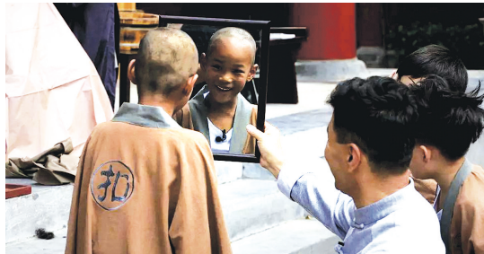
65 你看我萌吗?