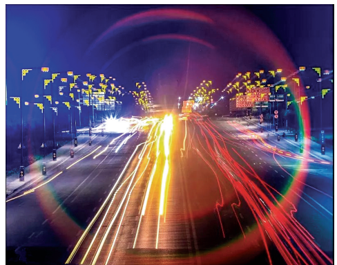
63 归来如梦

读者和网友可以通过关注郑州晚报登封播报微信公众号 dfbb62776277 和以下网站,参与投票和查询此次活动相关信息。 登封论坛 www.dengfeng.cn 登封网 www.dengfeng.so 嵩山网 www.songshan.tv 登封在线网 www.452470.cc