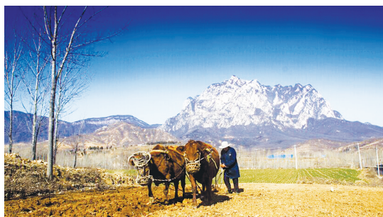
64 那人、那牛、那地