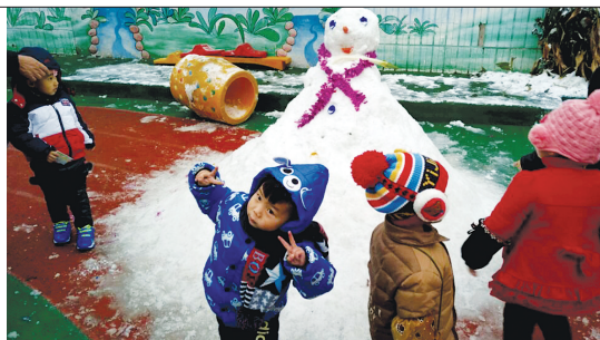
67 雪人吸孩童