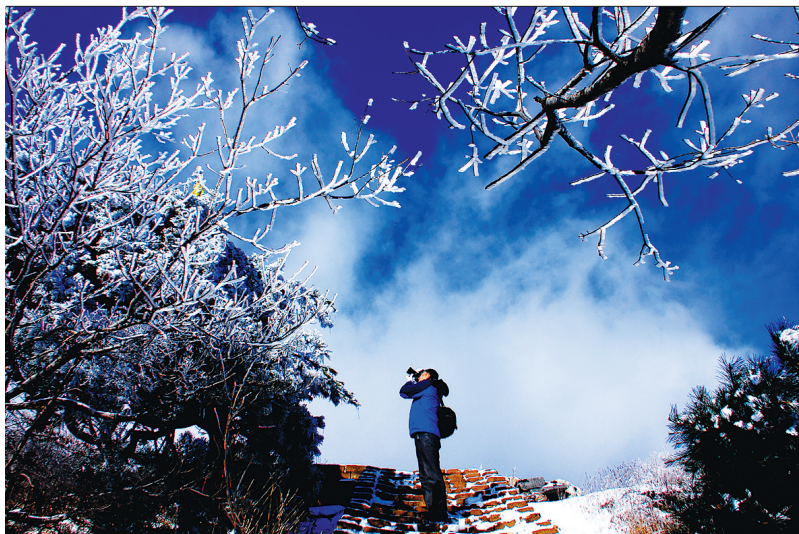
69 峻极峰顶