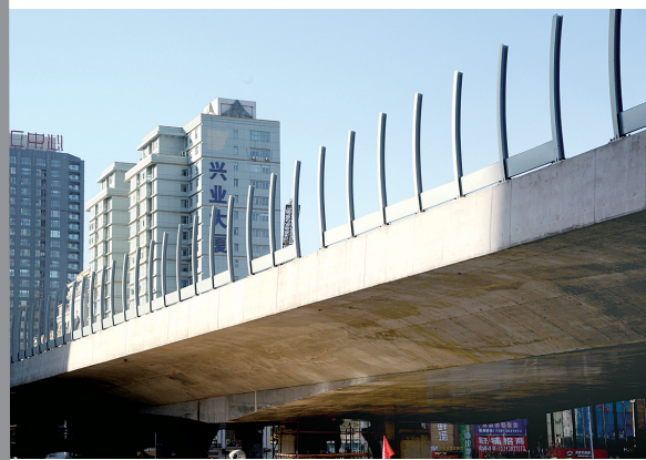
农业路(经三路段)已经开始安装声屏障