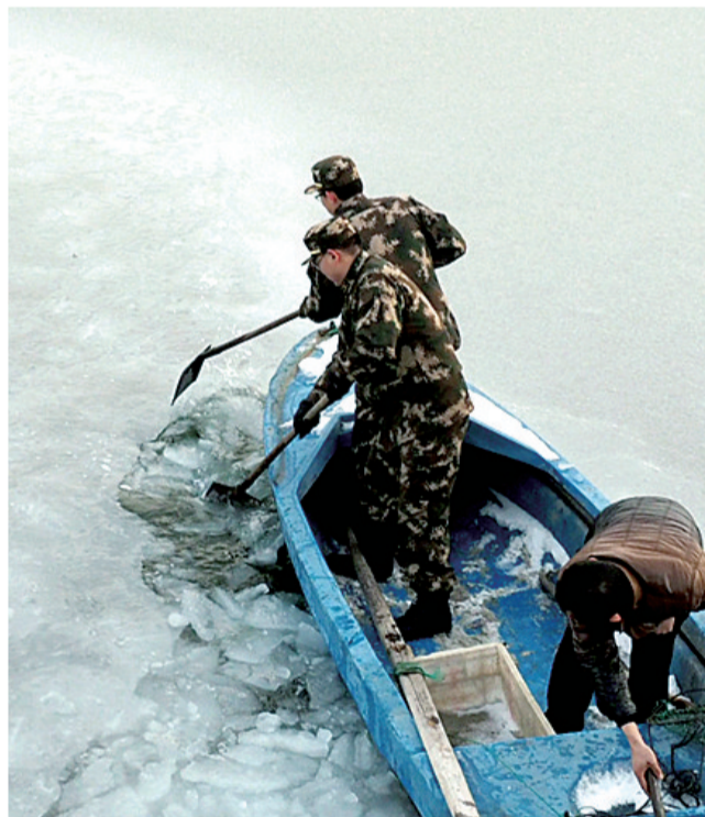
昨日,山东省烟台市养马岛边防派出所民警在破冰。