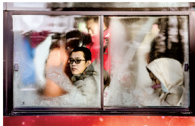
昨日,长春市一名乘坐公交车的乘客透过车窗上的冰晶望向窗外。