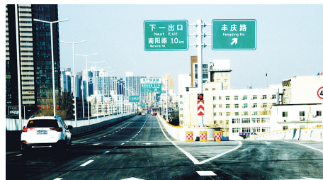
开通的丰庆路下桥匝道

农业路高架要实现桥梁东西、畅达南北,还需要农业路高架—中州大道、农业路高架—京广快速路、农业路高架—西三环三座互通立交的投用。昨日记者从农业路高架—中州大道互通立交施工方处获悉,在建的4条匝道均是农业路高架通向中州大道方向,5月份前可全部开通。郑州晚报记者 冉小平 张玉东/文