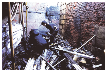
火灾后,在灰烬中翻找婚戒

昨日凌晨5时许,农业路与嵩山路口一店面发生火灾,店主刚进回来的价值8万多元的原材料和部分财产化为灰烬,最让年轻店主难受的是,他准备回家结婚的全部手续和礼服首饰也在火场内化为灰烬。