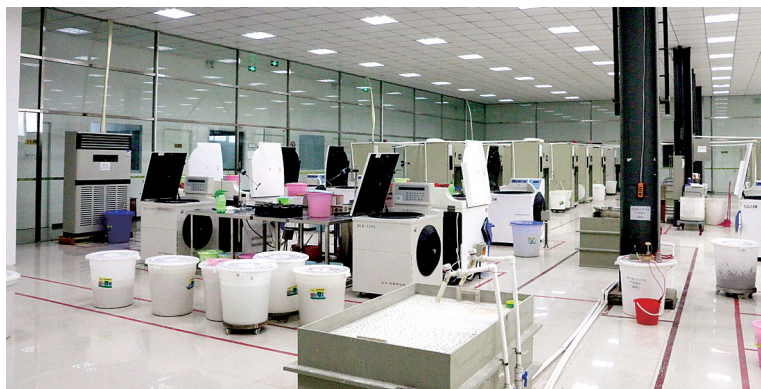
白鸽项目金刚石微粉生产线