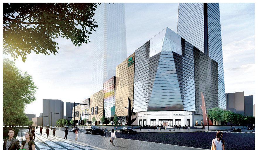
正在建设中的郑州又一地标性商业综合体——大商金博大城二期