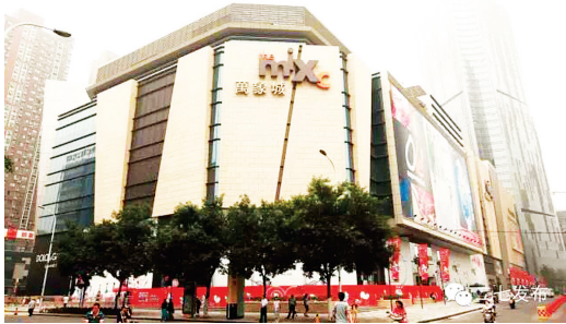
全国第六座华润万象城购物中心