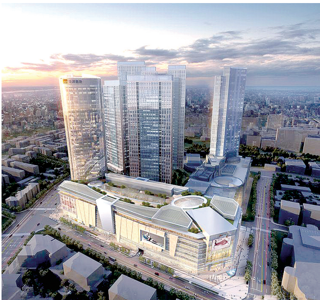
郑州首座甲级写字楼华润大厦