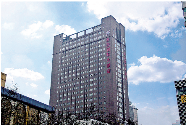
按照国际五星级标准打造的新亚国际大酒店

5年来,街道先后获得“郑州市文明单位”“郑州市民族团结进步示范单位”“郑州市平安建设先进乡镇街道”“郑州市城市精细化管理工作第一阶段先进单位”“郑州市民族团结进步模范集体”“郑州市信访工作四无乡镇办”“郑州市户外广告整治先进办事处”等多项荣誉。记者 李佳露