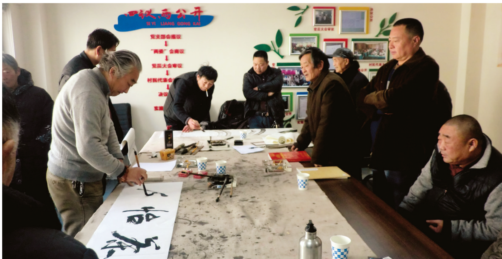
书画家为村民挥毫泼墨

新春之际,郑州高新区西史马村,时兴以文会友,西史马村籍书画家自己作品当礼品,回乡文化省亲,受到乡邻的欢迎。