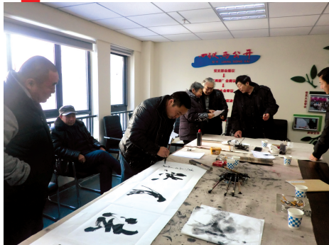
书画家为村民现场写书法