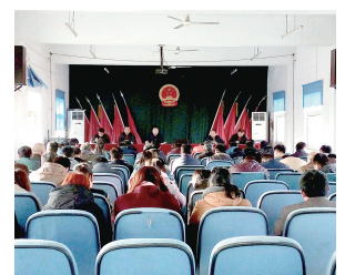
刁家乡召开“收心会”

记者了解到，2016年，刁家乡将按照全县的总体发展目标，以新型城镇化为引领，突出“农”字做文章，加大新型农村