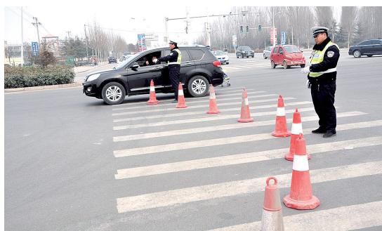
对部分路段实施交通管制

春节,中国最重要的节日。春节假期,市民都在尽情游玩,享受与家人团聚的欢乐,然而,有一群人却在站岗值班。2月13日,绿博园和方特欢乐园,大量市民开心游玩,中牟交警却在站岗值班,连吃饭都是蹲在马路上。不少市民称赞这是今年春节就餐“最美的吃姿”。