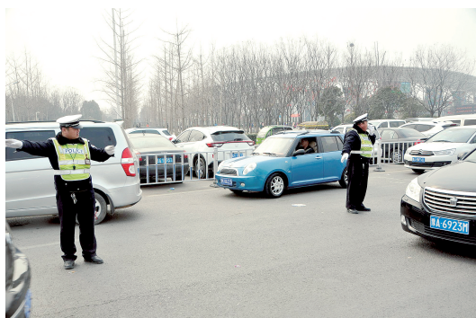
民警正在认真指挥交通