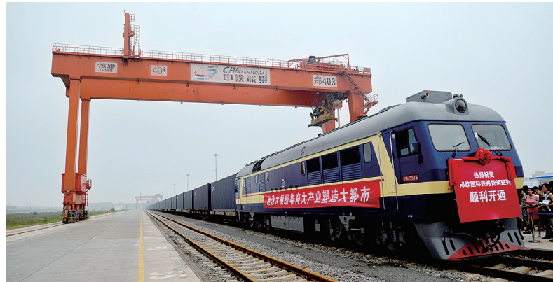
依托郑欧班列,郑州打开了一扇经济之窗。

依托郑欧班列,郑州再次打开了一扇经济之窗,串联起“新丝路”沿线的中亚和欧洲国家,激活了丝绸之路经济带的源头活水。初步确立了连通境内外、辐射东中西的新丝绸之路经济带物流枢纽地位,成为河南积极实施国家“一带一路”战略的重要载体以及全球经济要素互换的重要通道。国家汽车整车进口口岸、进口肉类口岸、进境粮食指定口岸……相继落地,不沿边不靠海的郑州,如今已经成为对外开放的前沿阵地。