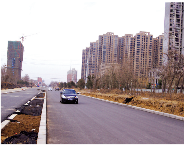
广武路南段不再“卡脖子”