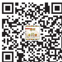
扫一扫 关注郑州名师堂