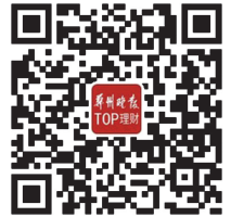
扫码了解活动详情

本报“金融丽人秀”活动今日启动 拨打56568142报名 您还将有机会成为大众评审员