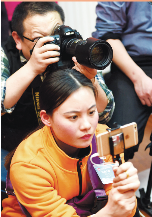
相机、录音笔……这都是郑州全媒体记者的标配