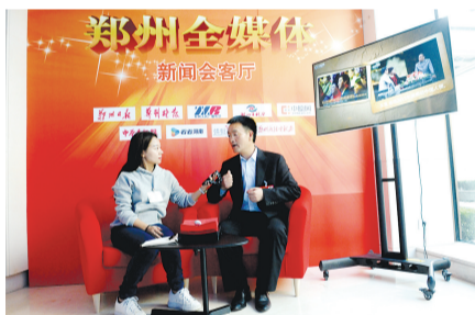
大咖做客 郑州全媒体新闻会客厅