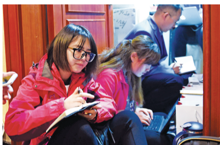
苦思冥想只为让您看到好新闻