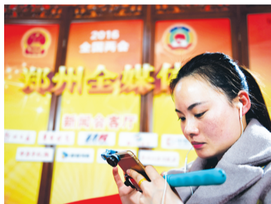
加了镜头附件的手机,变成了采访神器

随着2016年全国两会大幕的拉开,各路精英、大咖在记者的邀请下将陆续来到“会客厅”,郑州全媒体报道团队也会将这些精英、大咖的“声音”第一时间呈现到大家面前。