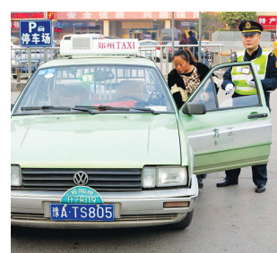
这辆出租车装有“小老虎”

本报讯 昨日,2016年春运正式结束。在春运返程期间,郑州晚报记者曾两次走访郑州火车站,报道该地区出租车不按规定站点停靠、议价、宰客等不文明行为,市交运委执法支队深入调查了解后,于3月2日开始对火车站东、西广场进行突袭查处。 当日7时10分,在火车站东广场南出站口处,几辆出租车横七竖八地停靠在出租车通道旁,司机正忙着与乘客议价。十几名执法人员将这几辆出租车包围。 现场6辆出租车的司机对于自己违规行为没有过多辩解,执法人员将车辆开往停车场,而一辆车牌号为豫ATS805的出租车上安装有“小老虎”。 执法队员表示,自即日起,将对火车站宰客的不文明行为进行大力打击,一旦查出将按照规定进行顶格处罚,查扣的