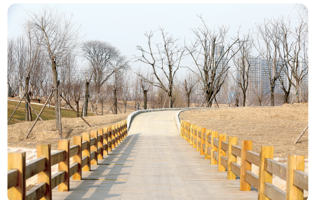
步行于此,当十分惬意