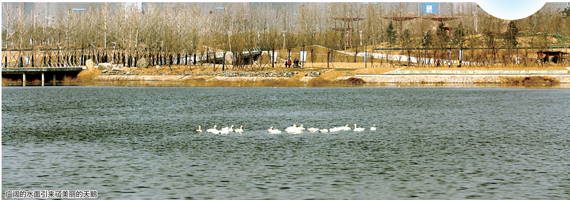
广阔的水面引来了美丽的天鹅