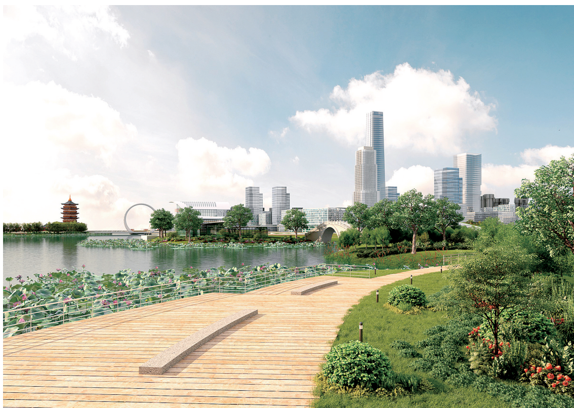
滨河国际新城美景