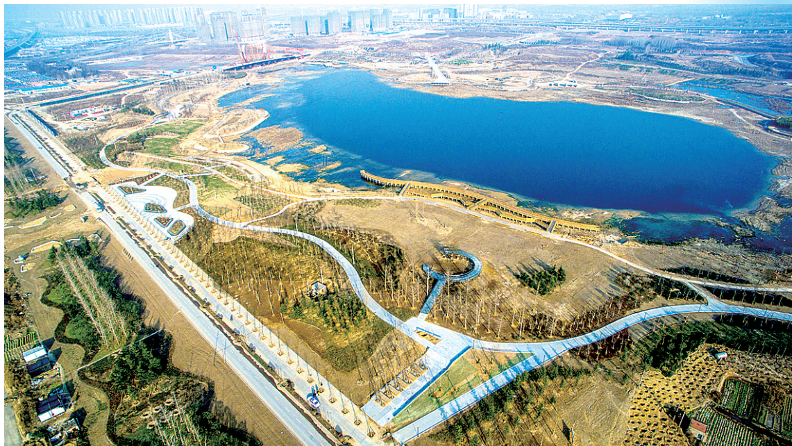
蝶湖在建区域俯瞰