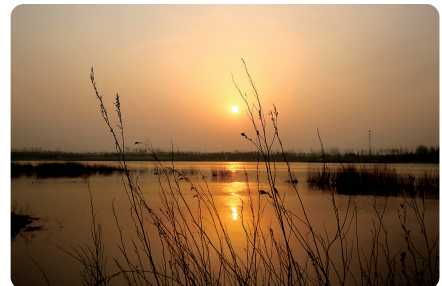
日出日落,美不胜收