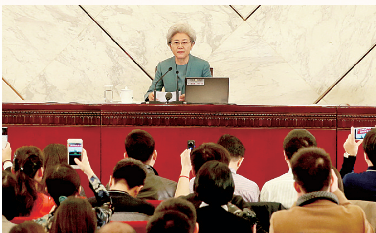
傅莹就大会议程和人大工作相关的问题回答中外记者的提问