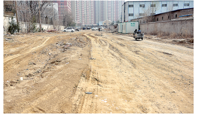
燕凤北路上有很多尘土