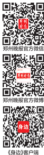
郑州晚报官方微信