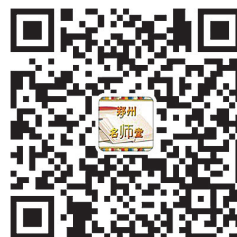
扫一扫 关注郑州名师堂