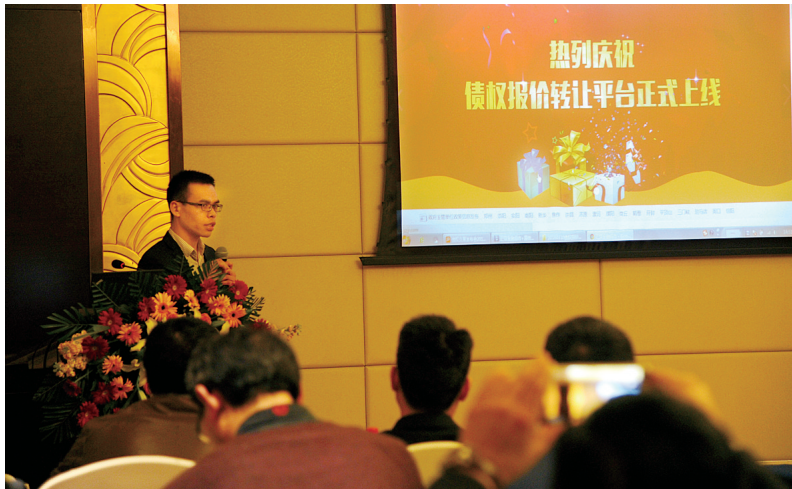
正信互联网金融超市有关负责人介绍债权报价转让平台

本报讯 如何破解债务困局,使资产高效流转、让债权动起来,拓宽融资渠道成为不少企业面临的问题。昨日,河南正信中小企业金融超市有限公司(以下简称“正信金融超市”)债权报价转让平台上线暨签约仪式发布会在郑州举行。一手连接债权持有方,一手连接专业的处置机构,与律师事务所、会计师事务所等多家专业机构合作,通过专业机构的处置,盘活、处置债权资产,拓宽企业的融资渠道,激活一潭春水。郑州晚报记者 徐智慧/文