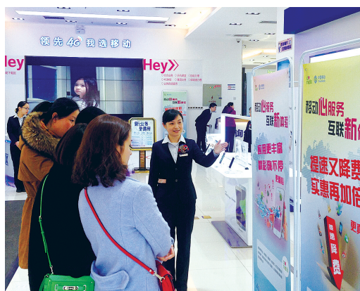
郑州移动CBD营业厅工作人员耐心讲解移动心服务