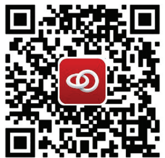
请扫描二维码下载