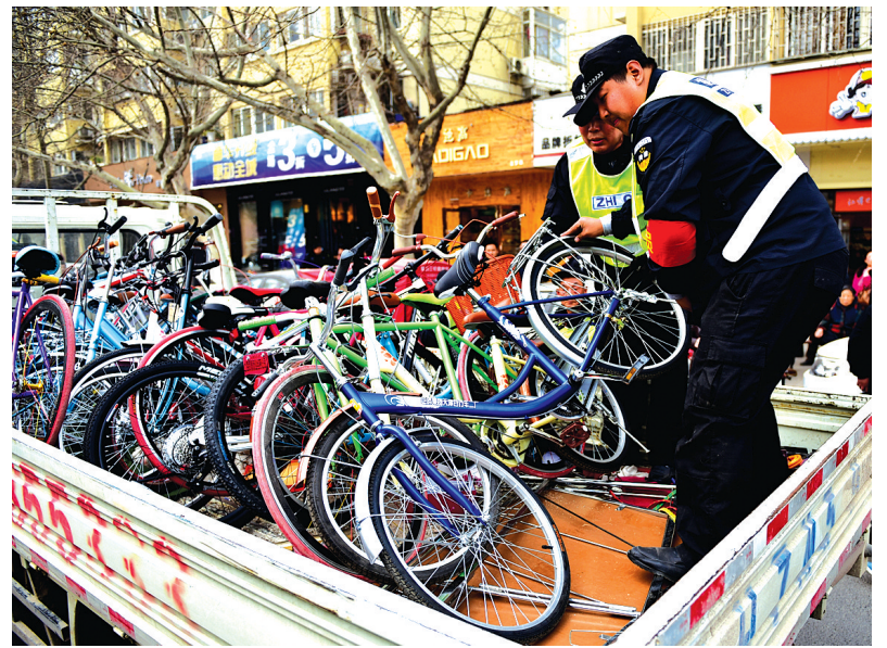
执法人员拉走占道经营的车辆