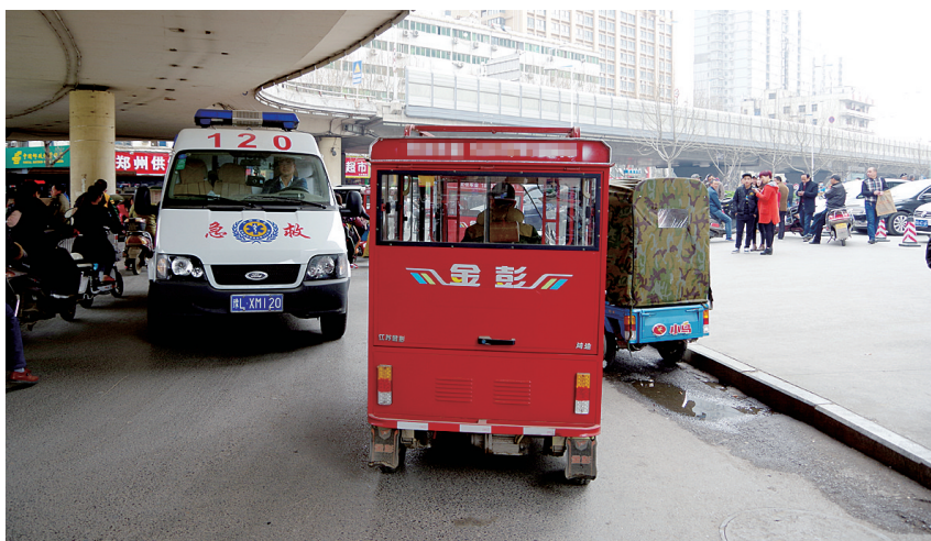
摩的扎堆堵住医院门口,急救车生命通道被堵

本报讯 昨日,针对河医区域存在的摩的扎堆,各类车辆乱停现象严重的情况,郑州交警三大队城市精细化管理专项治理分队开展专项治理行动,申请增加停车位,加大对违停车辆的处罚力度。 郑州晚报记者 汪永森 实习生 敬晨宇 通讯员 韩黎剑 徐振珂 文/图