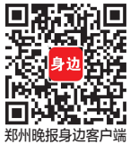
郑州晚报身边客户端