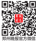
郑州晚报官方微信