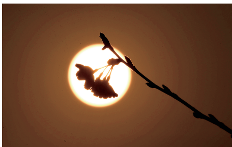
郑东新区,夕阳下,一簇盛开的樱花美丽的身影。