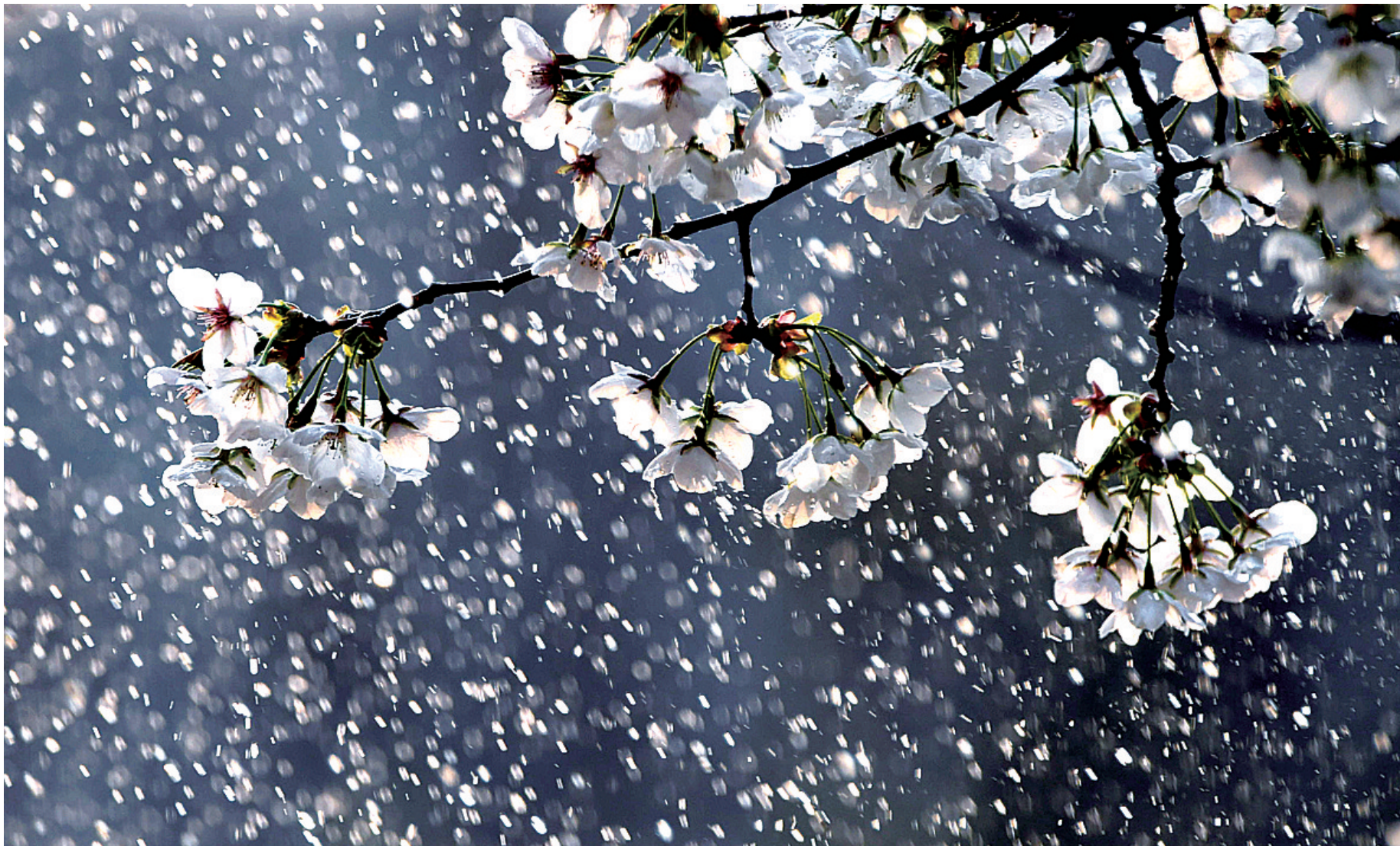
植物园,水洒过来,盛开的樱花树如同飘起美丽的花瓣雨。