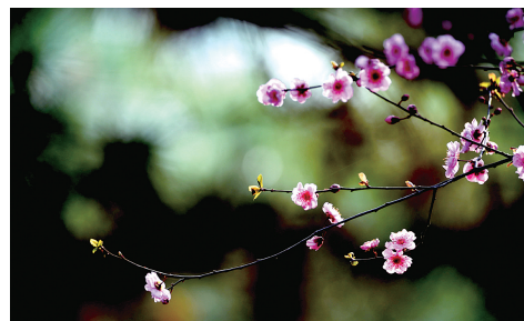
人民公园,美人梅在风中摇曳着婀娜的枝条。