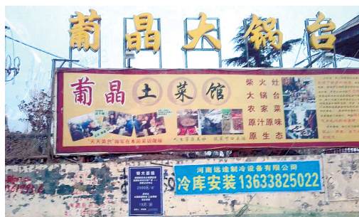
事发的二七区葡晶大锅台饭店暂时停业