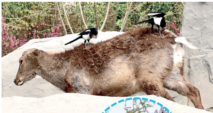
喜鹊在梅花鹿身上啄毛

喜鹊和梅花鹿,它们有什么关系?看似不相干的动物之间,却可能有着千丝万缕的联系。市动物园里,两只喜鹊站在梅花鹿的背上,将即将褪掉的鹿毛叨下来,衔到自己的窝里。而梅花鹿一动不动;动物园食草区周围,有许多鸟,这些鸟和鹿、羊、牦牛等动物和谐相处,甚至相得益彰,让人惊叹。