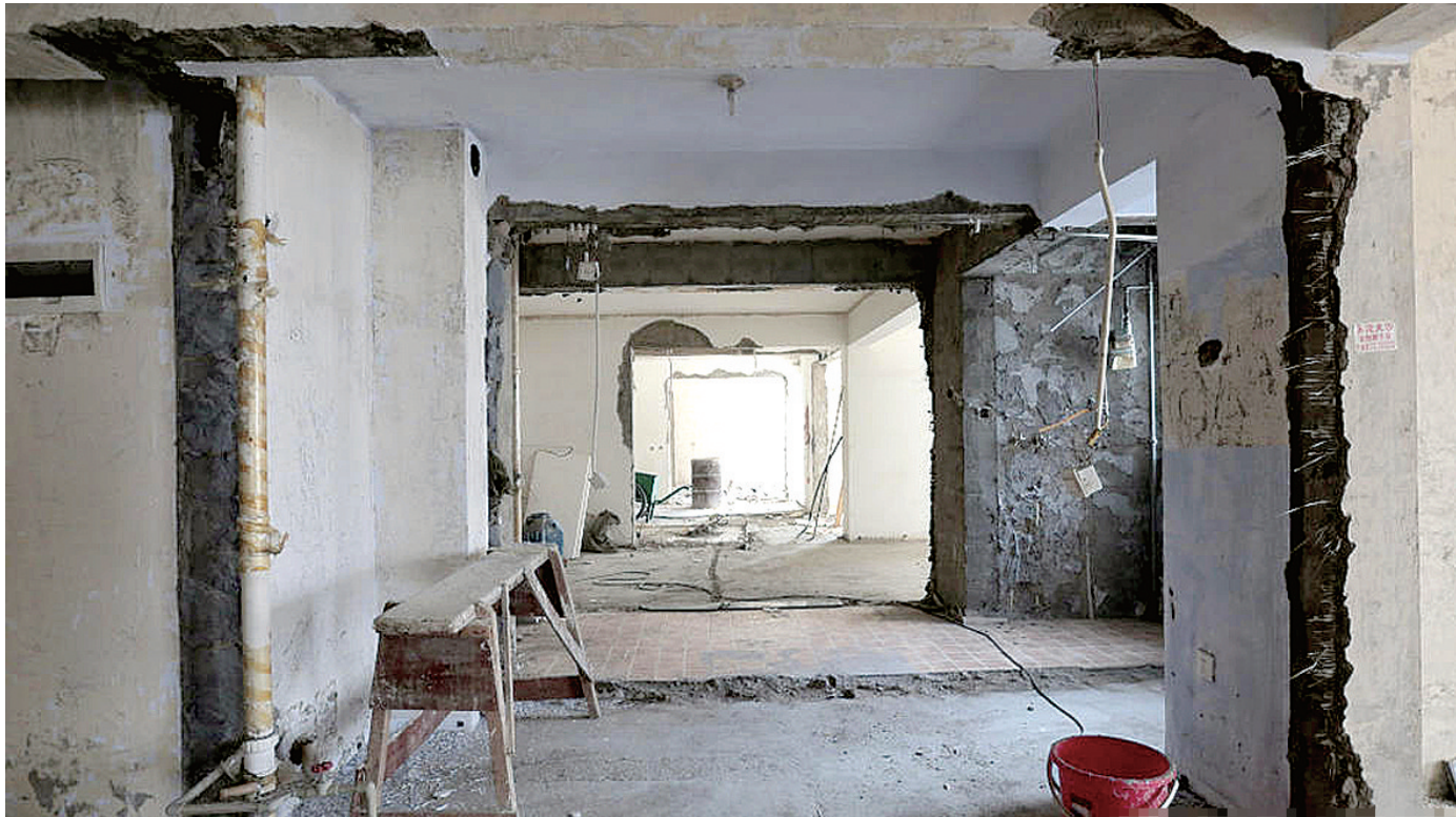
4套房子已被打通

本报讯 昨日,本报A08版报道了郑州一小区业主买下14楼同层4套房,想打通建500平方米“豪宅”,并且已将4套房子打通,多面墙体被破坏。但却遭到住在该楼的其他业主投诉,称担心楼房安全。如此装修到底存不存在安全隐患?昨日,郑州晚报记者再次走访该小区,并跟随房管、城建等部门工作人员进行了现场鉴定。 郑州晚报记者 谢源茹 冉小平 文/图