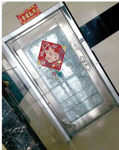
入户大门直接安在了电梯间旁边

本报讯 昨日,本报A08版报道了郑州一小区业主买下14楼同层4套房,想打通建500平方米“豪宅”,并且已将4套房子打通,多面墙体被破坏。但却遭到住在该楼的其他业主投诉,称担心楼房安全。如此装修到底存不存在安全隐患?昨日,郑州晚报记者再次走访该小区,并跟随房管、城建等部门工作人员进行了现场鉴定。 郑州晚报记者 谢源茹 冉小平 文/图