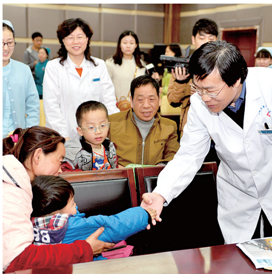
市二院医生询问患有眼疾的小朋友恢复情况