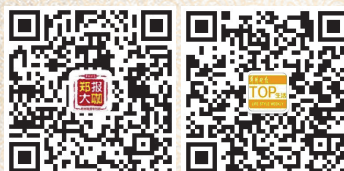
郑州晚报官方微信 (TOP生活)官方微信