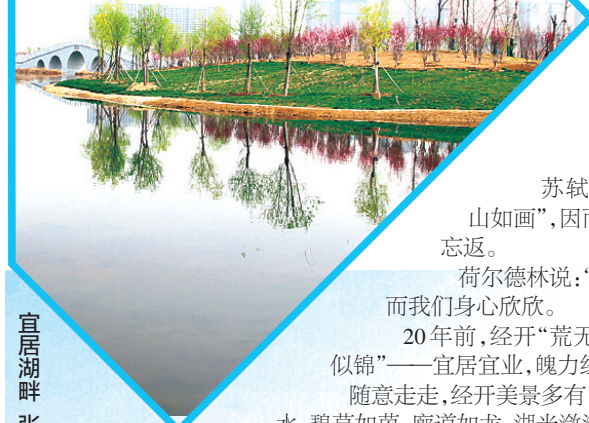
宜居湖畔