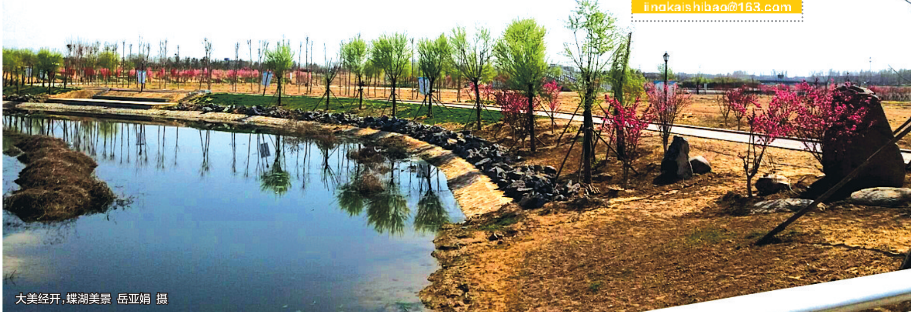
大美经开，蝶湖美景