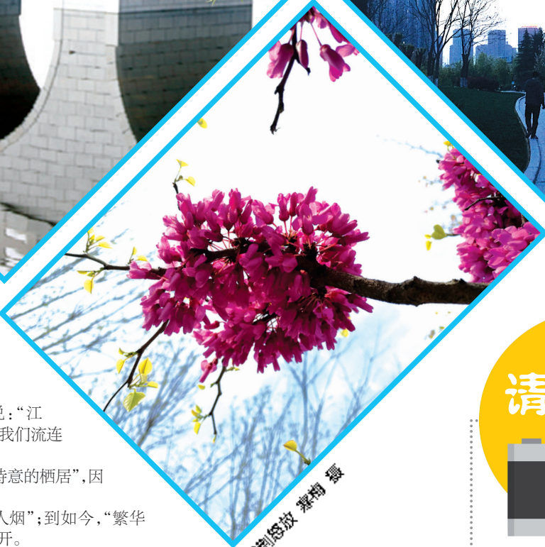
紫荆怒放