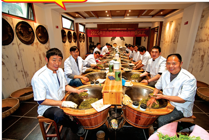
卢正浩手工炒茶中心

阳春四月,春意盎然。如果能在这个时候品上一杯上等的西湖龙井那将是件多么惬意的事情。