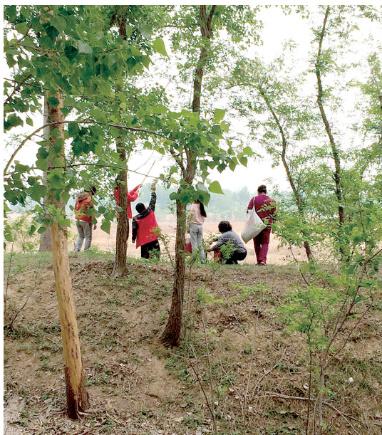
可持续性采摘才能确保槐树来年继续生长

近期,市区内外槐花陆续开放,进入一周左右的槐花采摘黄金期。近日,因为缺乏安全意识,一市民在采摘槐花时持用金属工具触碰了高压线,造成当场身亡。