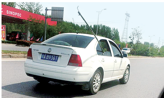
附近村民采槐花,多是用家里的竹竿或木棍