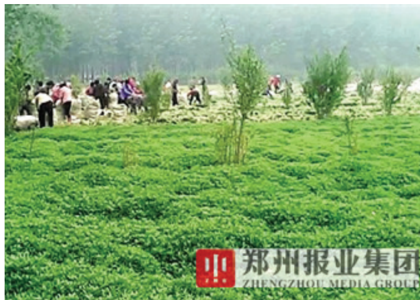
图为农民正在收割今年的第一批救心菜