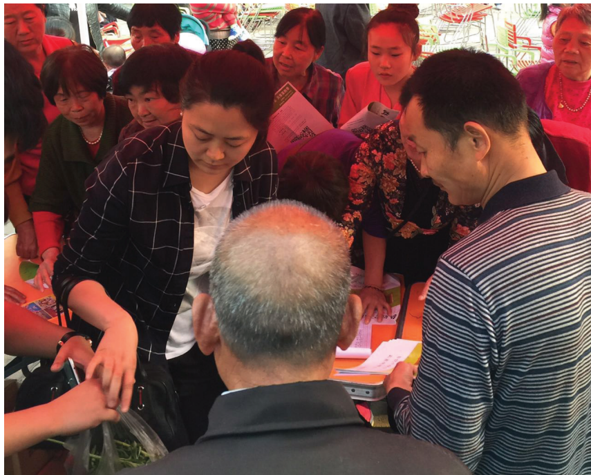
图为登记台前发生抢购的场面

中，救欣宝曾几次出现断货，用于免费发放的救心菜也被一大包一大包地从场外的运输车上不停地拉到现场，但在临近活动结束后，工作人员不经意地说了一句“货可能真的不够了”，本来排得好好的队伍一下子骚动起来，后面的人都拥挤到登记台的四周，围得让人喘不过气来。有一位老大爷，他第一次来现场时因带的现金不够，特意问了活动的结束时间后就慌忙回家取钱，结果再赶到现场时已经没有了货，他显得特别生气。他同其他几位没有买到货的顾客一直纠缠着工作人员想办法再运些货来。最后经过商议，决定在周一之前，答应给他们免费送货到家，这样他们才算满意地离开了活动现场。