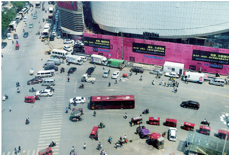
昨日,钱塘路和菜市街交叉口已经看不到了占道商贩

本报讯 昨日,本报报道了钱塘路大量商贩占道经营的情况后,管城区多个部门立即行动,对占道经营情况进行了整治。昨日中午,记者再次暗访时发现,钱塘路东侧已没有了占道经营情况,道路也通畅了。南关街道办事处一负责人说,他们将在重点路段、重点时段进行盯守,防止占道经营反弹。郑州晚报记者 王军方 文/图