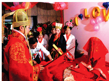
新人“秤”挑新娘盖头