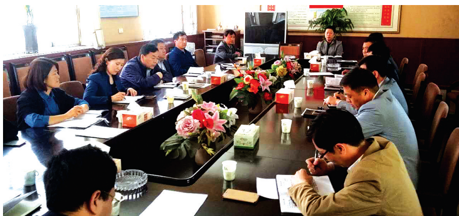
班子会研究产业用地