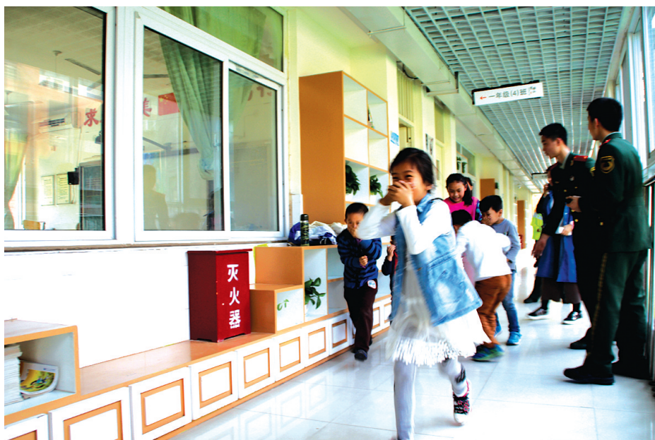
孩子们体验火场逃生

为提高青少年消防逃生知识,郑东新区团工委联合郑东新区消防支队、郑东新区如意湖办事处、郑东新区昆丽河小学、郑州市郑东新区和乐社