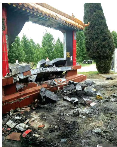
惨烈的事故现场,砖墙被撞塌

本报讯 昨日上午,@焦作日报发布微博:武陟县黄河控导工程25号大坝发生伤亡事件,5月2日凌晨1时24分,武陟县大封卫生院接到急救电话,在武陟县黄河驾部控导工程25号坝发生人员伤亡。在救助现场,发现一辆摩托车撞到大坝防护墩上,造成1人死亡,2人受伤。医护人员在对受伤人员施救时,一