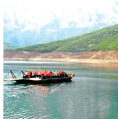
深水打捞救援队正在搜救