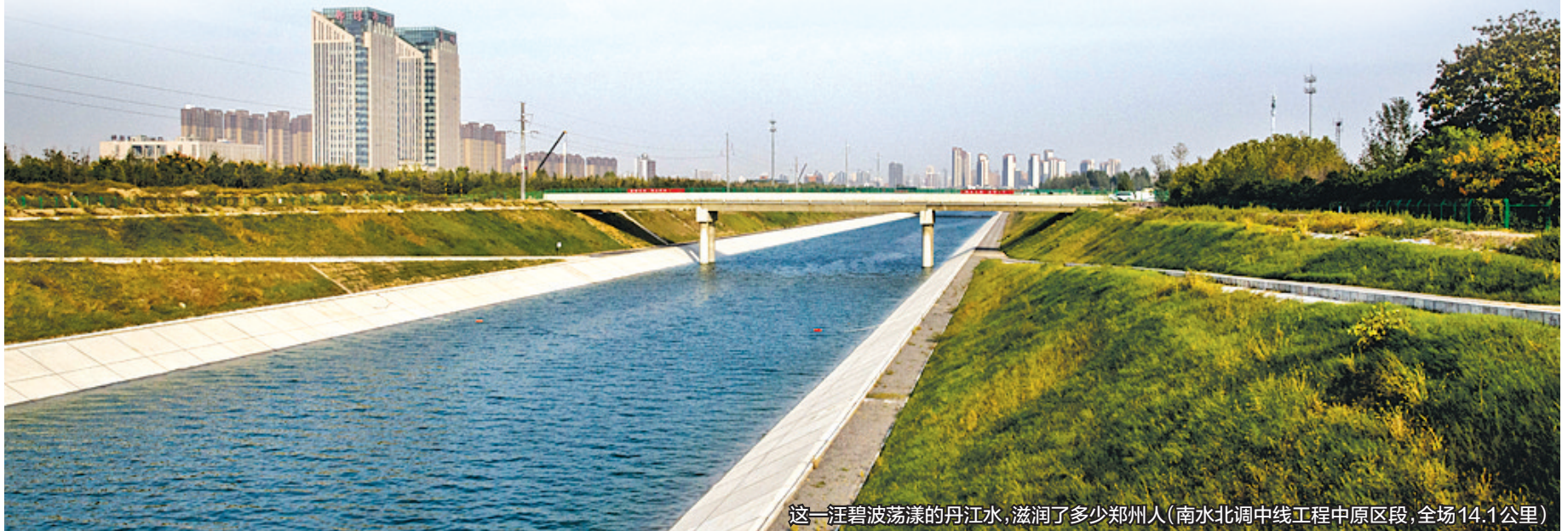
这一汪碧波荡漾的丹江水,滋润了多少郑州人(南水北调中线工程中原区段,全场14.1公里)