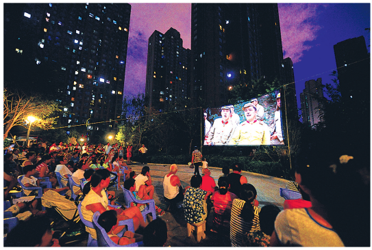
放上一场露天电影,大伙儿又聚在了一起