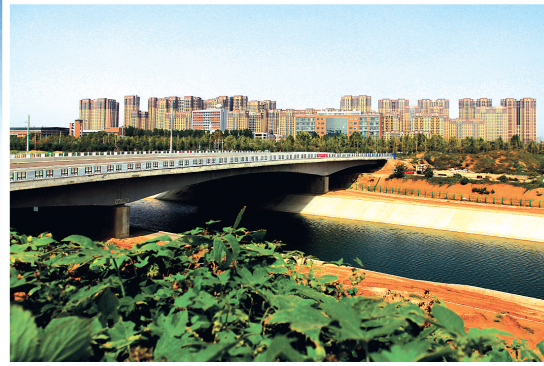
南水北调中线干渠在中原区穿越了14个行政村