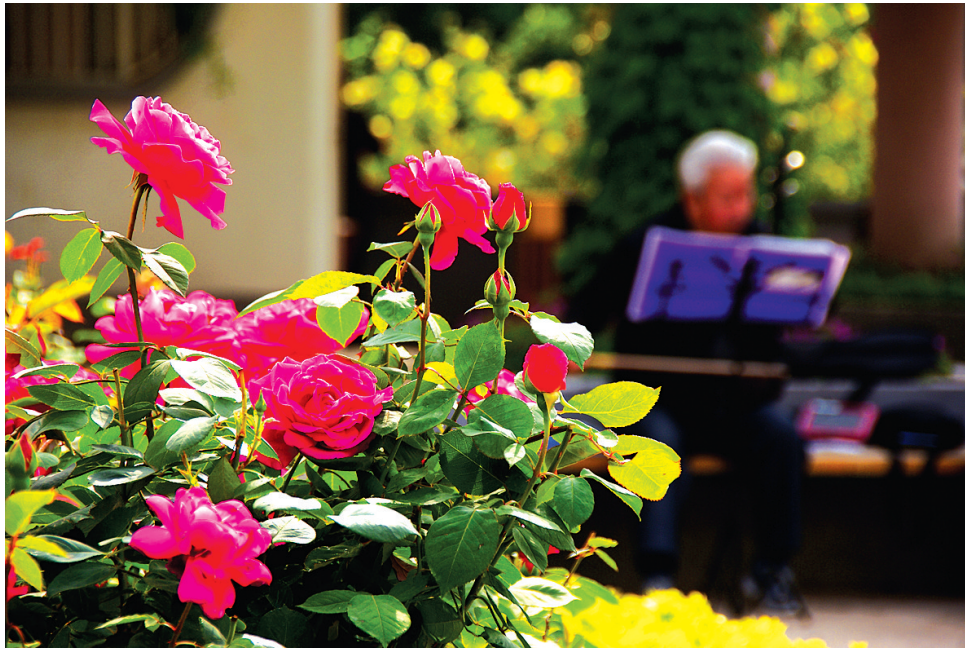
在月季园里,抚上一把琴,读上一本书,退休生活有滋有味