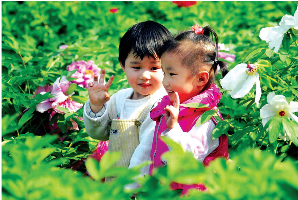
在好水好景的孕育下,孩子们的笑脸如此纯净和美好